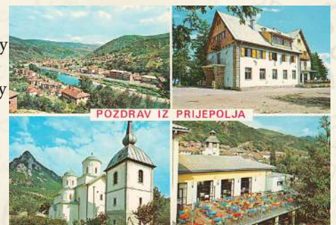
POZDRAV IZ PRIJEPOLJA